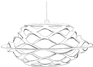
FloLight I - Medium Ø 60 cm, h: 27 cm