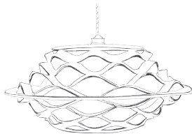
FloLight I - Small Ø 36 cm, h: 16 cm